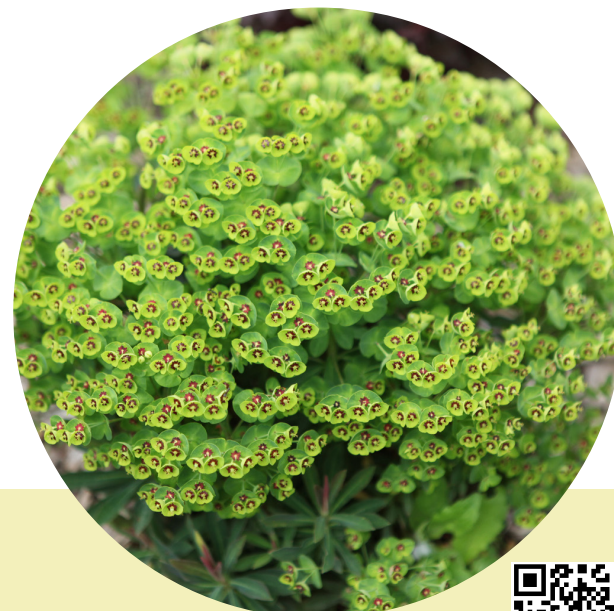
Walberton's® Tiny Tim