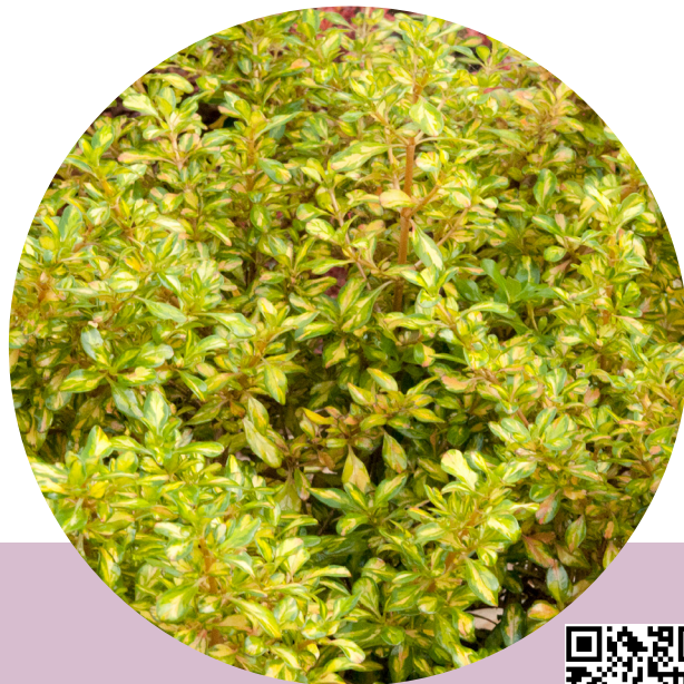
Lemon & Lime