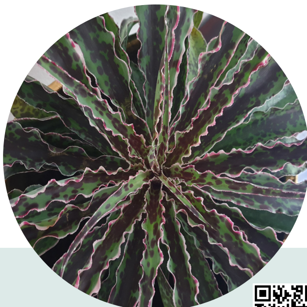
Cherry Chocolate Chip