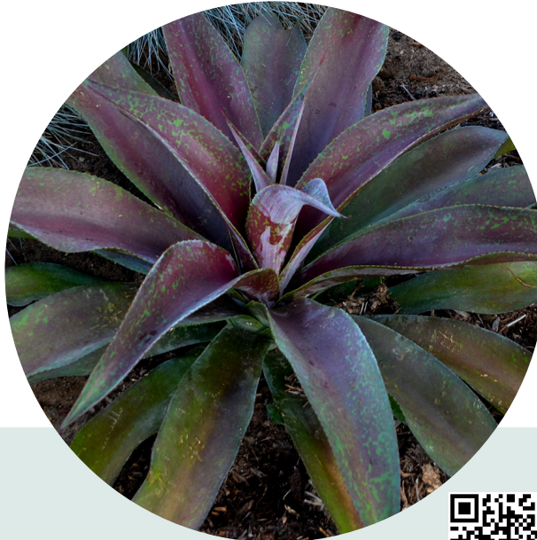
Mission to Mars