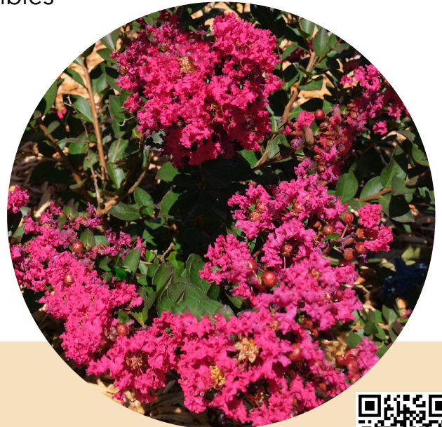
Red Red Wine