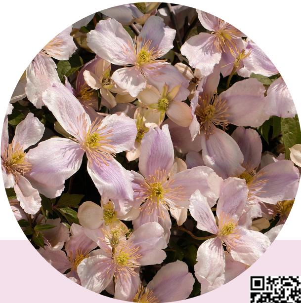
Pink Giant Star