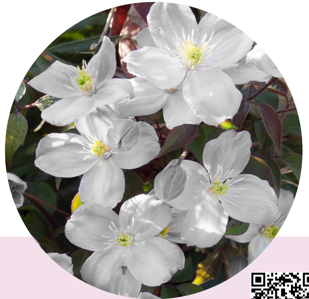
White Giant Star